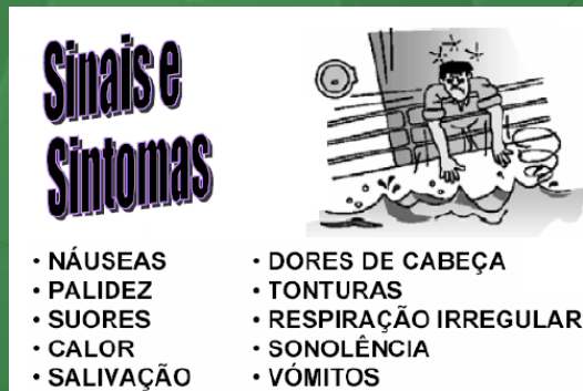
Figura 03 – sinais e sintomas

A Figura 03 apresenta, de forma sintética, os sinais e sintomas provocados pela exposição à vibração de corpo inteiro e que recebe a denominação de Mal dos Transportes, uma vez que está associada a veículos em geral, tais como navios, caminhões, trens, plataformas, entre outros.