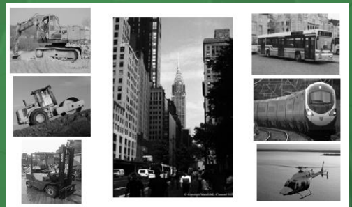
Figura 1: Situações do cotidiano em que há a presença de vibrações de corpo inteiro.

específicas para atividades de transporte. É transmitida através das superfícies de apoio, ou seja, os pés, para uma pessoa de pé e os pés, as nádegas e as costas para uma pessoa sentada e as superfícies de apoio para uma pessoa recostada ou deitada. Estas vibrações são específicas para atividades de transporte, tais como caminhão, trator, empilhadeira, ônibus, trem, entre outros (ver Fig. 1) e são afetadas à norma ISO 2631.